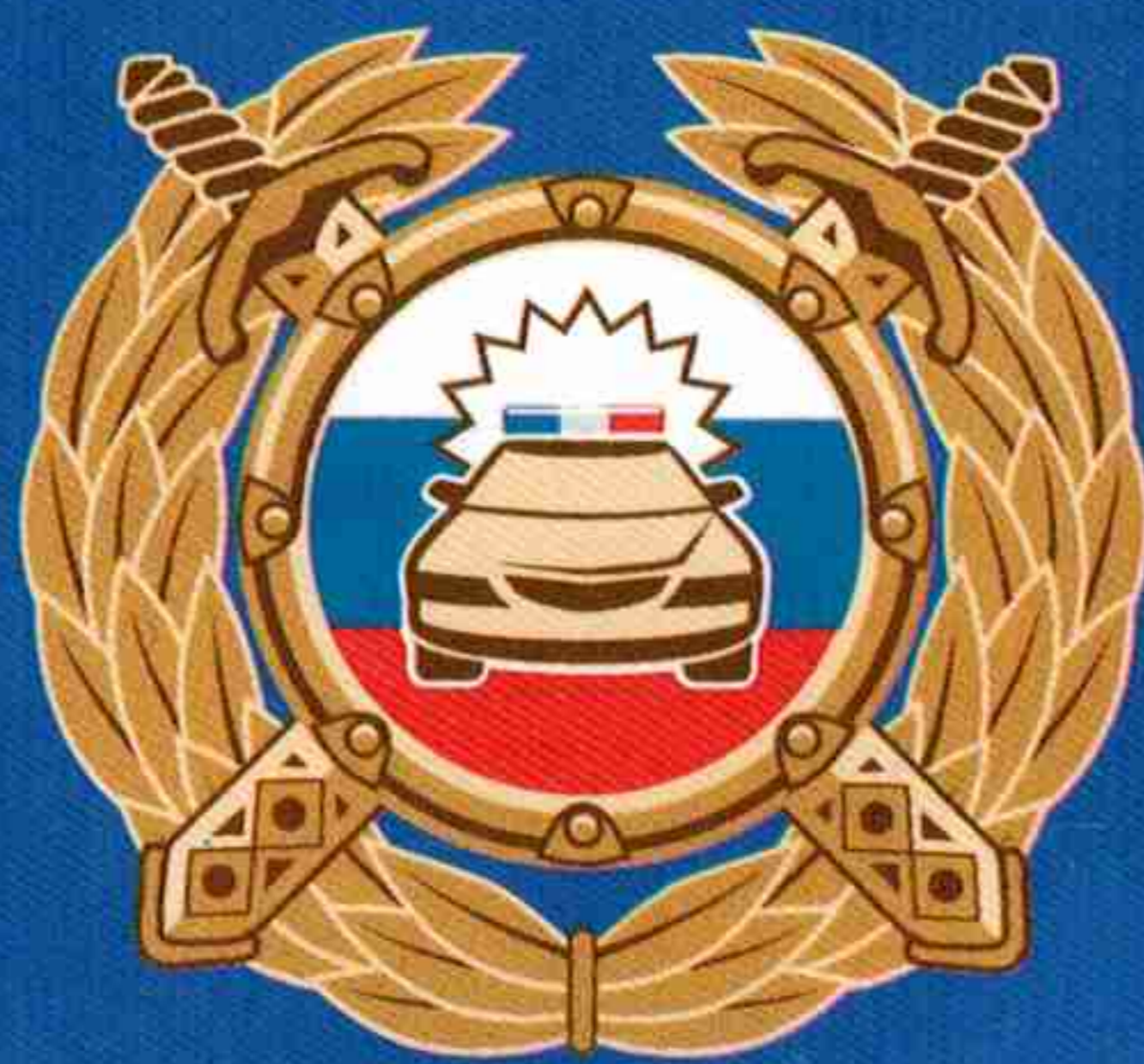
Госавтоинспекция МВД России

Буклет изготовлен по заказу Минпросвещения России в рамках реализации федеральной целевой программы «Повышение безопасности дорожного движения в 2013–2020 годах».